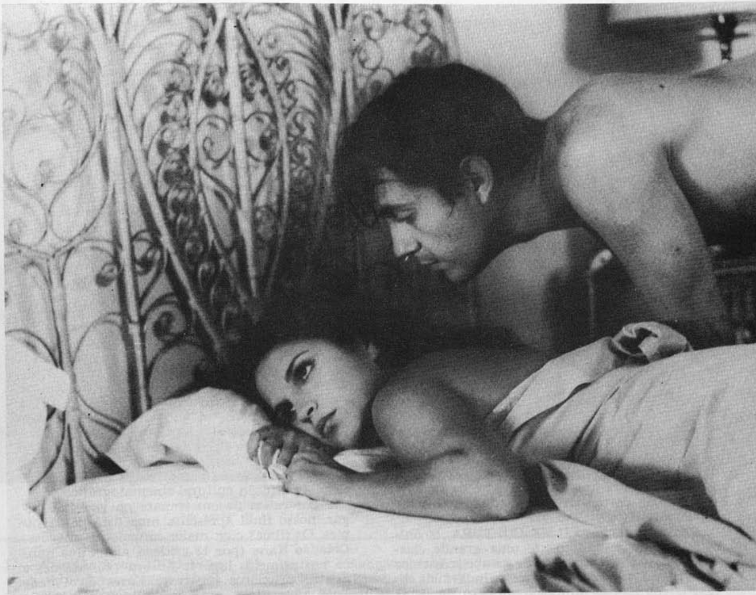
Paulo José e Leila Diniz em "O Homem Nu"