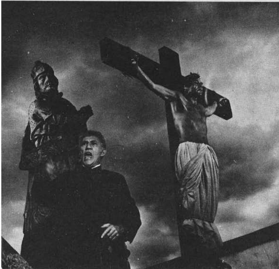
"A Madona de Cedro", de Carlos Coimbra