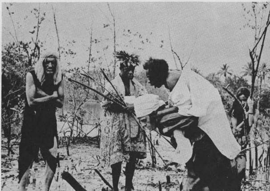
"Macunaima", de Joaquim Pedro de Andrade