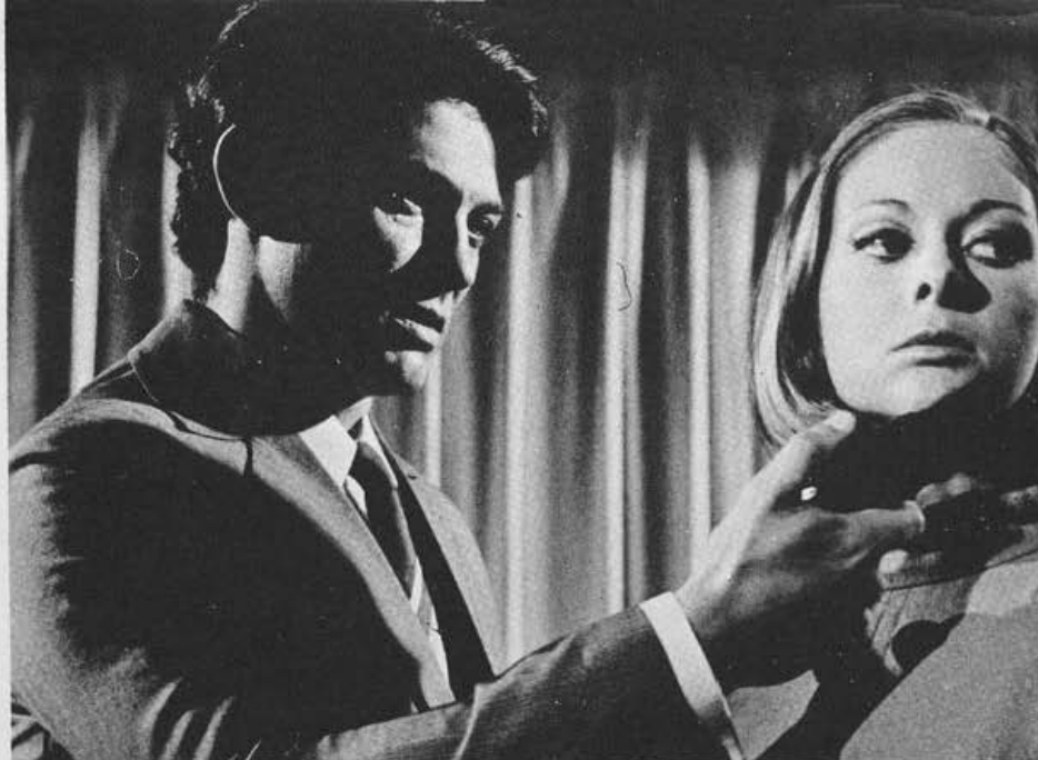
"Anjos e Demônios", de Christensen

Alguns filmes, em fase preparatória de produção, ainda não tinham diretor escolhido ao encerrarmos esse relato da ação do INC na área do financiamento à longa metragem.