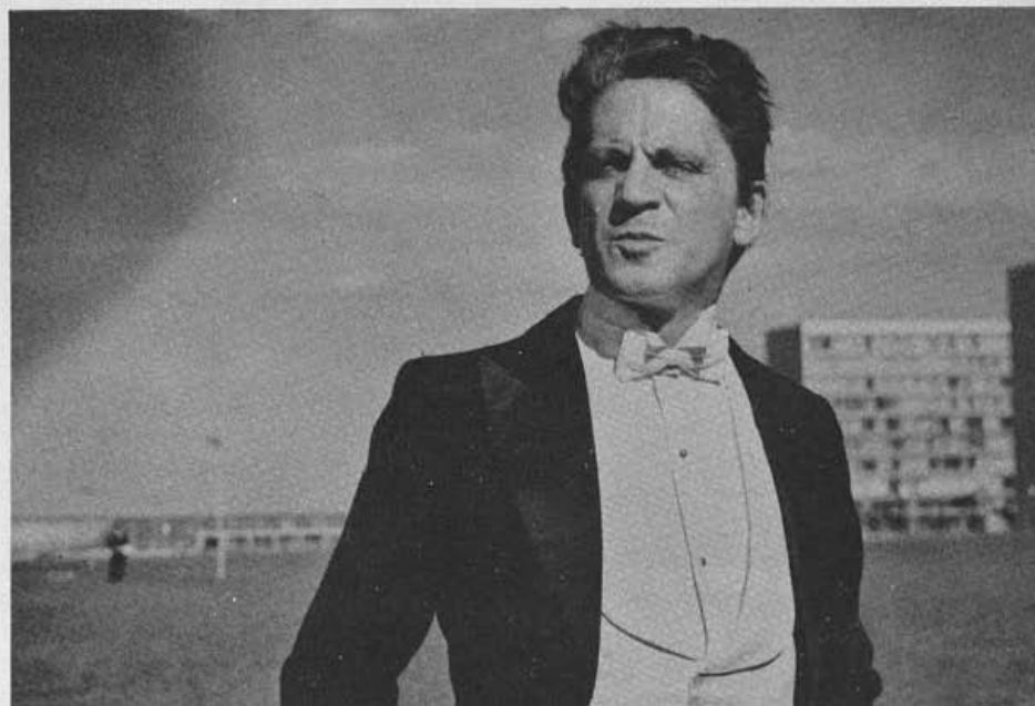
"Os Herdeiros", de Carlos Diegues