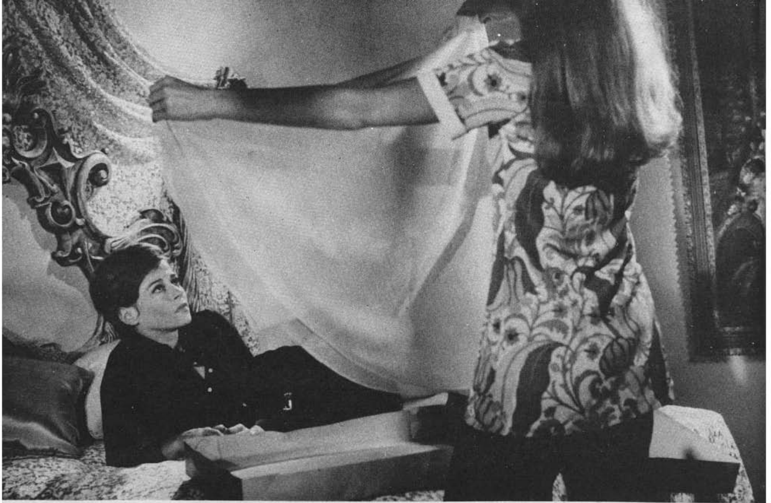
"O Palácio dos Anjos", de Walter Hugo Khouri