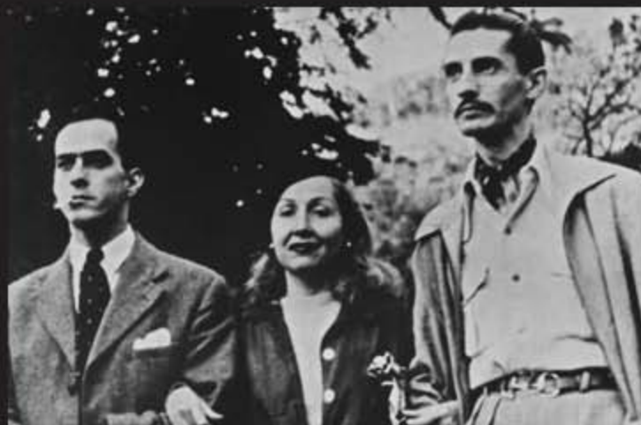
Vinícius de Moraes, Carmen Santos e Mário Peixoto

“Sabe-se que o cinema é um trabalho penoso, exaustivo, que requer qualidades, instrução, paciência, idealismo, perseverança, e os que se lhe dedicam não passam mais por doidos, nem as suas realizações são tidas como aventuras. Todo filme tem um fim honesto: civilizar, instruir, educar.”