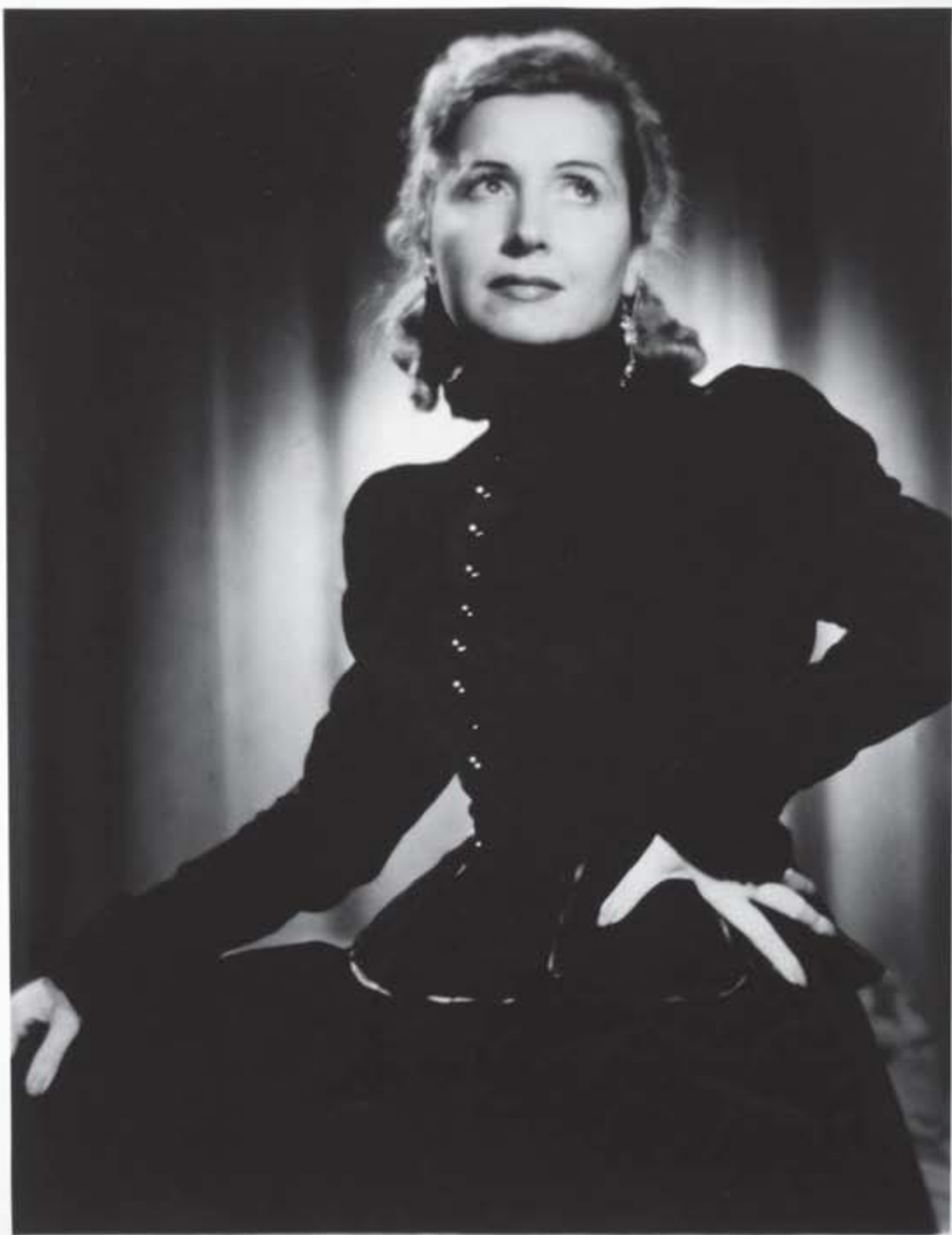
A Brasil Ultra Filme, apresenta: INCONFIDENCIA MINEIRA Dirigido por CARMEN SANTOS