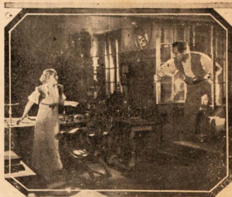
Scene from "THE REBEL" — UNIVERSAL SPECIAL

Vilma Banky, a heroína da extraordinaria produção da Universal, "O Rebelde", foi uma das mais populares "stars" do "ceran" antes do advento do som. Logo após seu casamento com