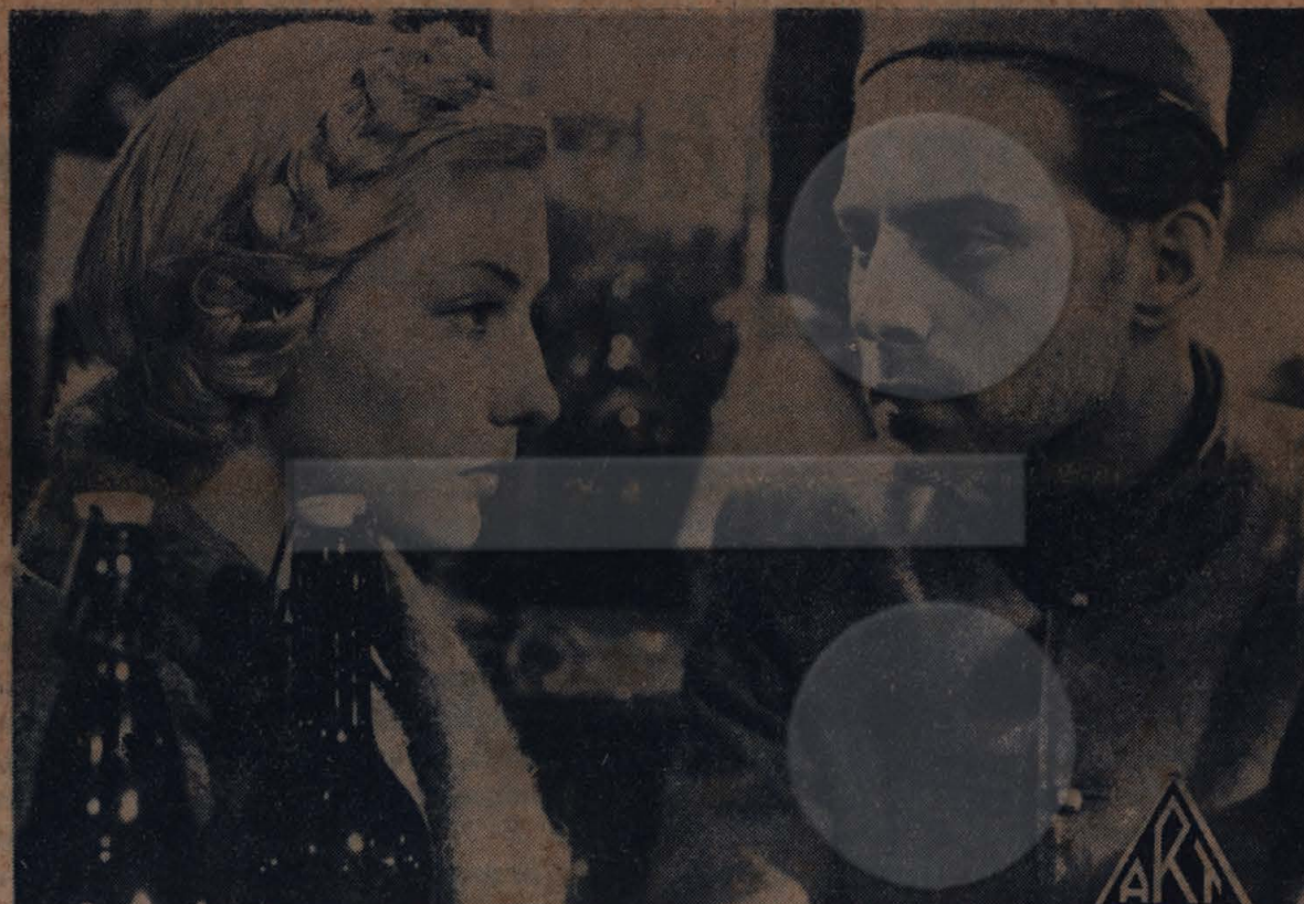
Uma scena do film "A CAMINHO DO FRONT" da Art-Films