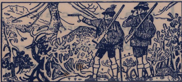
Três caprinos se escondem dos caçadores. Onde estão eles?