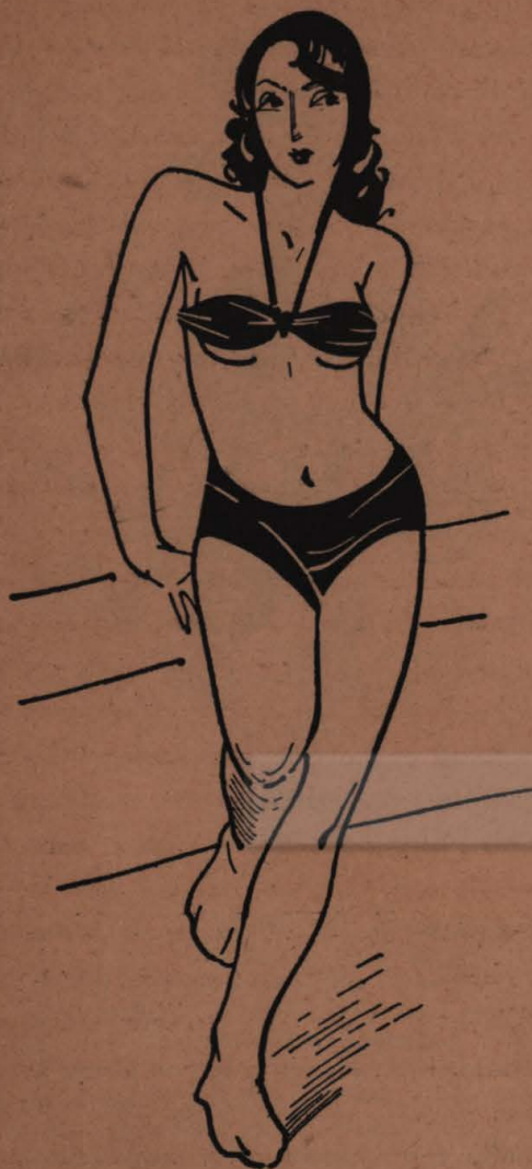
Modelo "Samarang" para banho de mar

T IVE o prazer de assistir ha dias, em "pre-view", o film "Samarang".