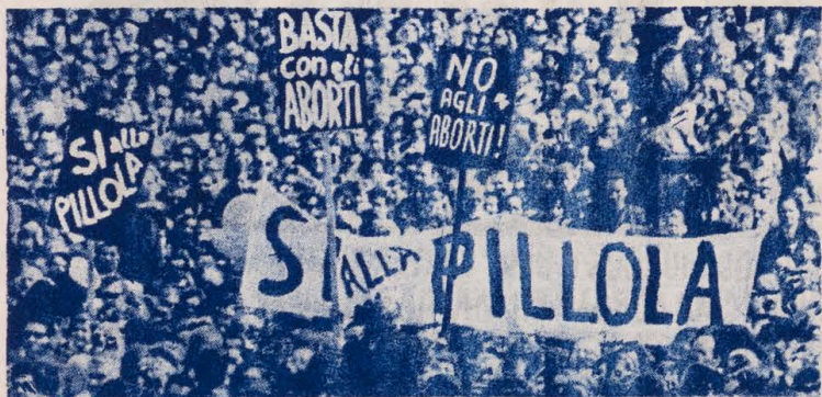
UMA MANIFESTAÇÃO REALIZADA EM 28 DE MARÇO DE 1967, EXIGIU DO PAPA "A PÍLULA", NA PRAÇA DE SÃO PEDRO!

EXIGEM MESMO DO PAPA: QUEREMOS A PÍLULA!