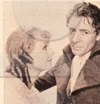
Ronald Colman e Elizabeth Allan. Romance n'A QUEDA DA BASTILHA...

Entre as scenas mais suggestivas e vigorosas de "A QUEDA DA BASTILHA" figuram as que se desenrolam no Tribunal, após os acontecimentos da Bastilha. Nessas scenas avulta o desempenho sensacional de Blanche Yurka, uma extraordinaria artista dramatica. Blanche, encarnando Madame DeFarge, "a chamma da revolução", torna essa sequencia uma emoção inesquecivel, graças ao calor de sua voz e á mobilidade de sua mascara extraordinaria. Sua scena com Edna May Oliver, quasi no final do film, quando Madame DeFarge quer impedir a fuga de Lucie Manette (Elizabeth Allan) para Londres, é outro trecho vigorosissimo de cinema-emoção. "A QUEDA DA BASTILHA" tem inicio em Paris, em 1765 e termina pouco após a queda do famoso forte, em 1789, tendo algumas sequencias passadas em Londres. Ao todo, o film apresenta 110 papeis, empregando suas scenas cerca de 6.000 "extras", movimentando-se todos em "sets" dos maiores até hoje vistos em espectaculos cinematographicos.