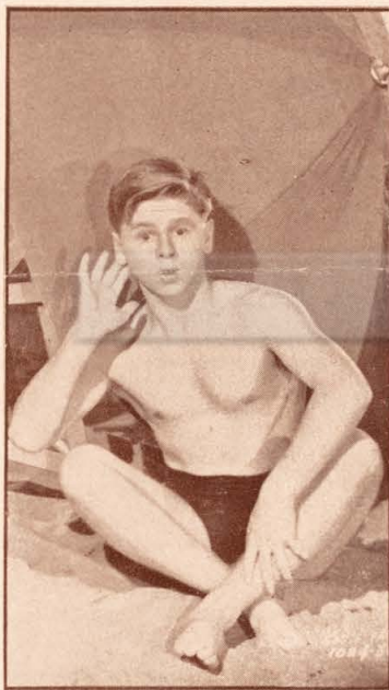
MICKEY ROONEY, O TERRIVEL!

Nos Estados-Unidos ha treze Clark Gables.