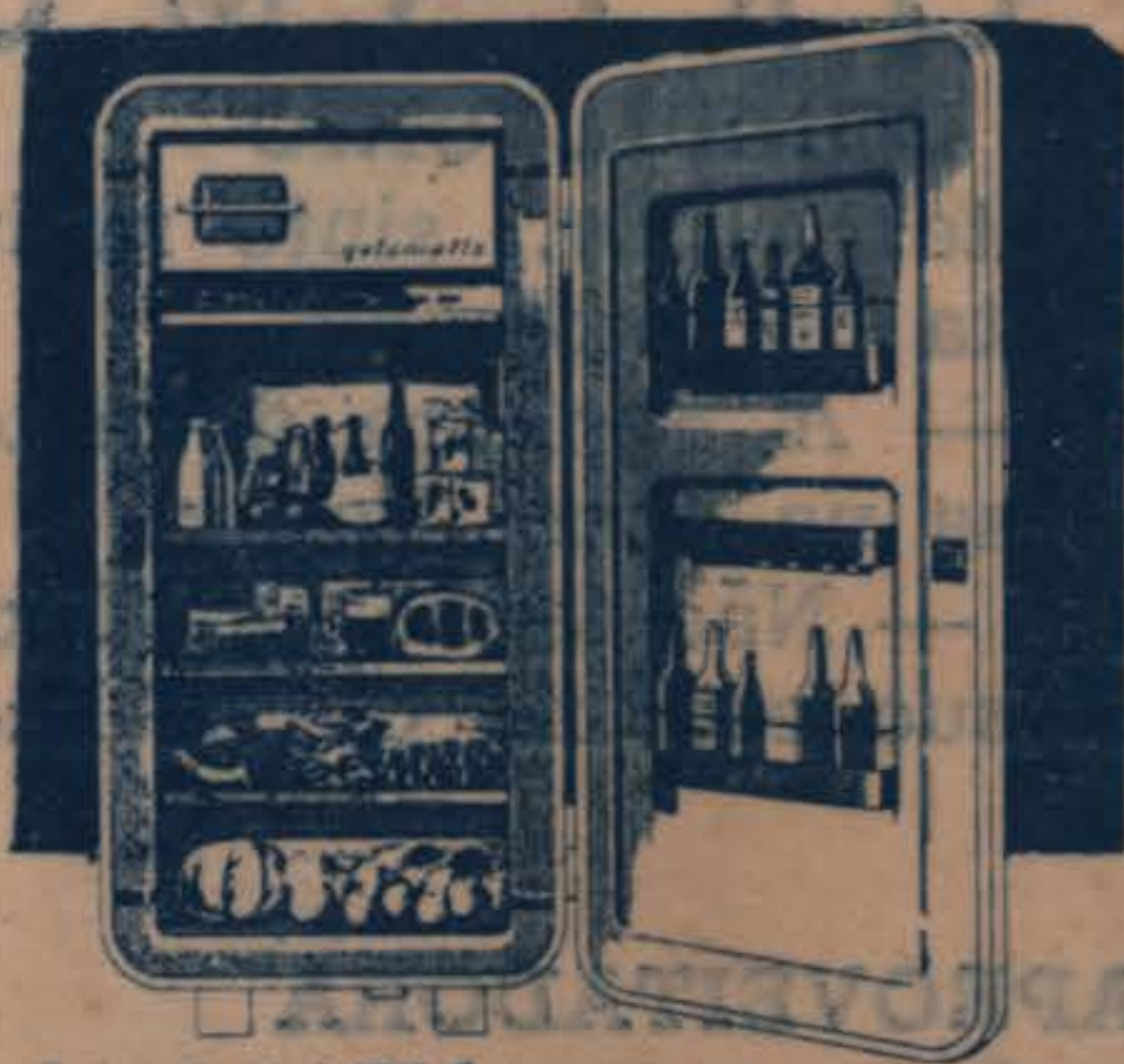
GELOMATIC - ELÉTRICA 7 PÉS - MOD. E 700 21.900 $