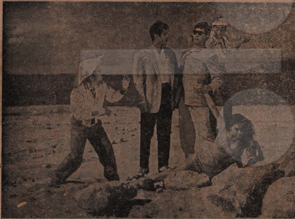
高島忠夫、宇津井健、坊屋三郎、万里昌代