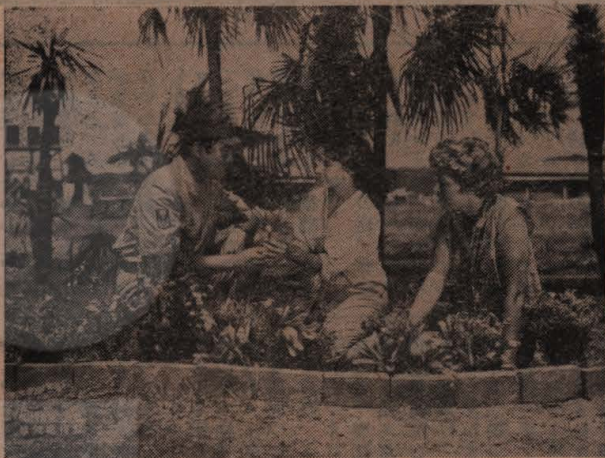
来る十七日 モナコ館封切予定