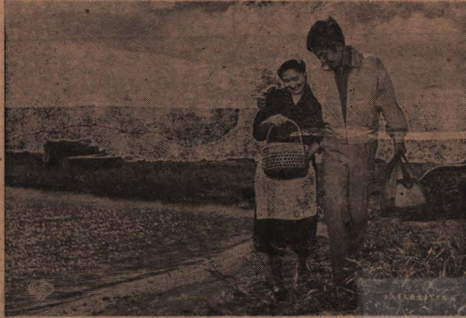
田中絹代、勝呂 誉、倍賞千恵子、川津祐介、佐田啓二、伴淳三郎

遠い故郷の母を思い、夢をえがいて都会の片隅に働く 若いはちきれない青春の生活詩！