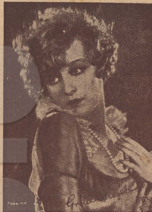
GRETTA NISSEN Estrella da "Paramount"