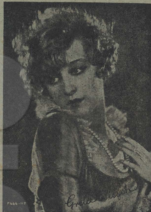
GRETTA NISSEN Estrella da "Paramount"