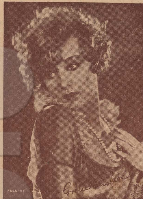
GRETTA NISSEN Estrella da "Paramount"