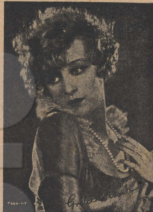
GRETTA NISSEN Estrella da "Paramount"