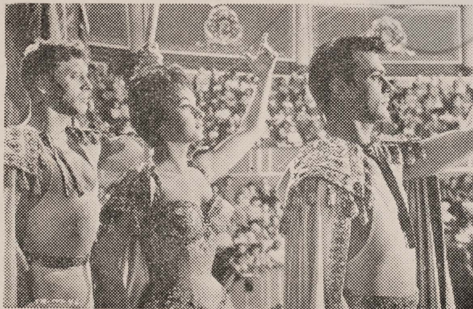
Burt Lancaster, numa de suas produ- ções, onde atuou ao lado de Tony Curtis e Gina Lollobrigida.

Durante as filmagens de "Trapezio", Burt teve ocasião de dirigir Tony na parte das acrobacias, orientando-o e ensaiando seus números, sem jamais ter demonstrado qualquer sinal de impaciência.